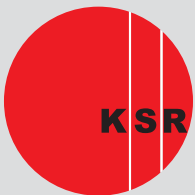
Kreissenioerenrat Landkreis Karlsruhe e.V.