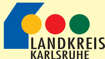
Arbeitskreis „Seniorenfreundlicher Service“