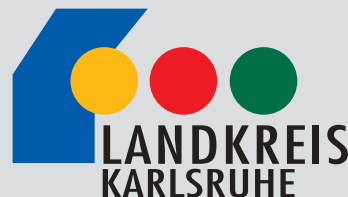
Arbeitskreis „Seniorenfreundlicher Service“