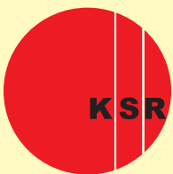
Kreissenioerenrat Landkreis Karlsruhe e.V.